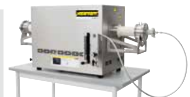
Kompakt csőkemence szinterezéshez vagy feszültségmentesítő izzításához a 3D nyomtatás után védőgáz vagy vákuum alatt