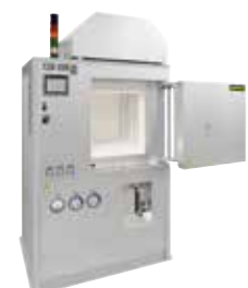
HT 160/17 DB200 kerámiák kötőanyag-mentesítéshez és szinterezéshez a 3D nyomtatás után 3D nyomtatás

Az additív gyártás kísérő, ill. elhúzódó folyamataihoz is kemence használatára van szükség a termék kívánt tulajdonságainak eléréséhez, pl. a porok hőkezeléséhez vagy szárításához.