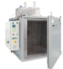
KTR 2000 kamrás szárító kötőanyagok megkeményítéséhez a 3D nyomtatás után