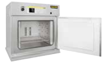
TR 240 szárítószekrény porok szárításához